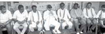
ಪ್ರಧಾನಿ ನರೇಂದ್ರ ಮೋದಿ ಅವರ ಸಮೀಪದಲ್ಲಿ ಕೇಂದ್ರ ಸರ್ಕಾರದ ಸಚಿವರುಗಳೊಂದಿಗೆ ನಾಗರಾಜ್ ಕೊಡಗುನು.

ಕೇಂದ್ರ ಸರ್ಕಾರ ಕೊಡಗಿನ ಭವನ ನಿರ್ಮಾಣಕ್ಕೆ 5 ಸಾವಿರ ಕೋಟಿ ರೂ. ನಿರೀತವಾಗಿತ್ತು. ಸ್ವಲ್ಪ ಪ್ರಧಾನಿಯವರೇ ಬಿಡುಗಡೆ ಮಾಡಿದ ಕೊಡಗು ನಿರ್ಮಾಣಕ್ಕೆ 5.11 ರಿಂದ ರಾಜಭವನ ಮುತ್ತಿಗೆ ಹಾಕಲಾಗುವುದು ಎಂದು ರಾಜ್ಯ ಕಚೇರಿಗೆ ಅಧಿಕಾರ ವಹಿಸಿ ನಾಗರಾಜ್ ಕೊಡಗುನು.